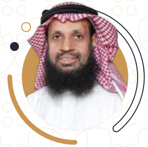
الدكتور خليل القصيمي